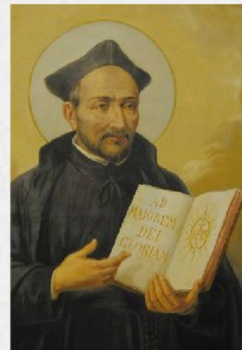
HL. IGNATIUS VON LOYOLA (KJB GRUPPENPATRON SALZBURG)

Als Novene beten wir ab 16. Oktober: Nimm hin, o Herr, meine ganze Freiheit, nimm hin mein Gedächtniss, meinen Verstand, meinen ganzen Willen. Alles was ich habe und besitze. Du hast es mir gegeben, zu dir wende ich es zurück. Nur deine Gnade und Liebe gib mir, dann bin ich reich genug und verlange nichts weiter. Hl. Ignatius von Loyola, bitte für uns!